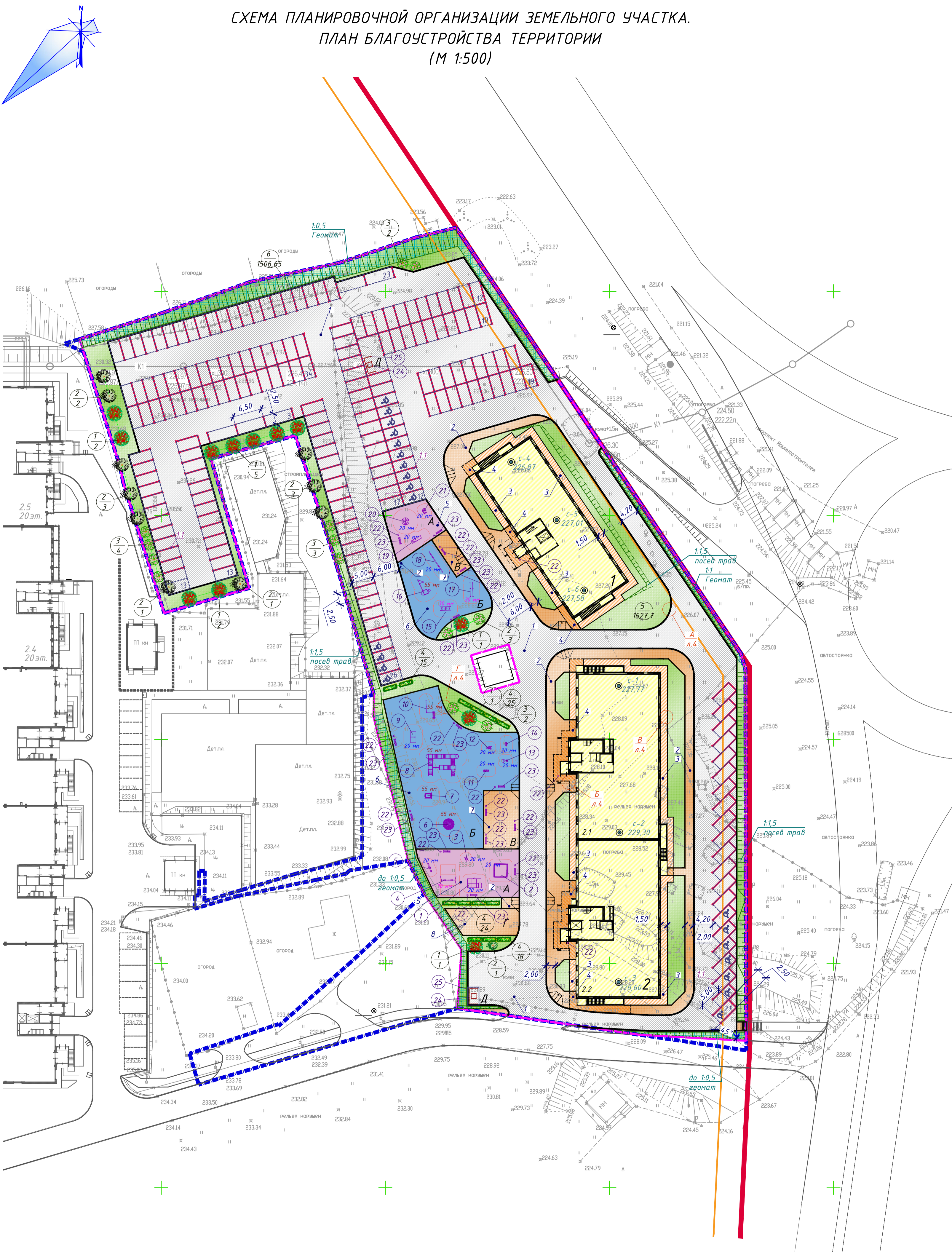
СХЕМА ПЛАНИРОВОЧНОЙ ОРГАНИЗАЦИИ ЗЕМЕЛЬНОГО УЧАСТКА. ПЛАН БЛАГОУСТРОЙСТВА ТЕРРИТОРИИ (М 1:500)