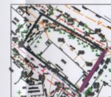
Охранная зона трубопроводов