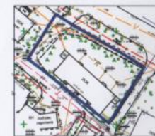
СЗЗ предприятия, сооружений и иных объектов

Чертеж градостроительного плана земельного участка разработан на топогеодезической основе, ООО "АС Калуга" в н/у году