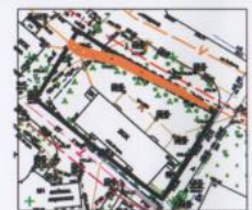
Охранная зона линий и сооружений связи

Сети инженерно-технического обеспечения: