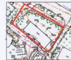
Приаэродромная территория аэродрома гражданской авиации Калуга (Грабцево), Подзоны: 7,6,5,3