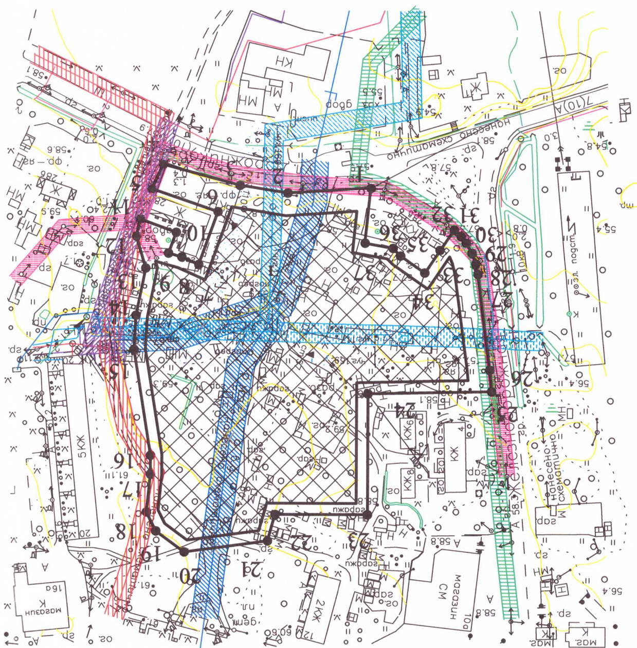
Чертёж градостроительного плана земельного участка и линии градостроительного регулирования