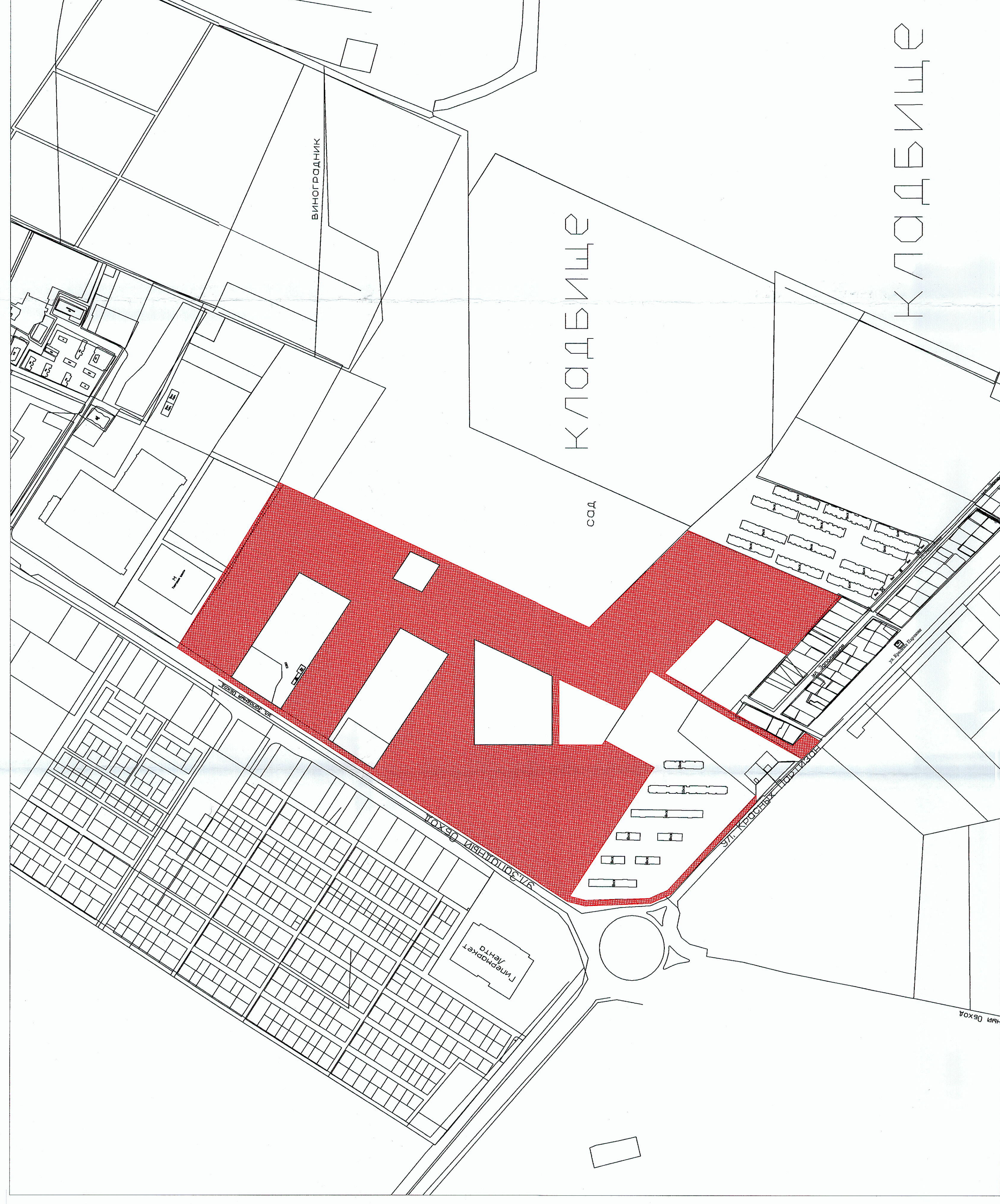
Схема расположения земельного участка в окружении смежно расположенных земельных участков