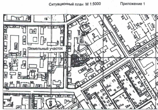
Ситуационный план М 1:5000 Приложение 1