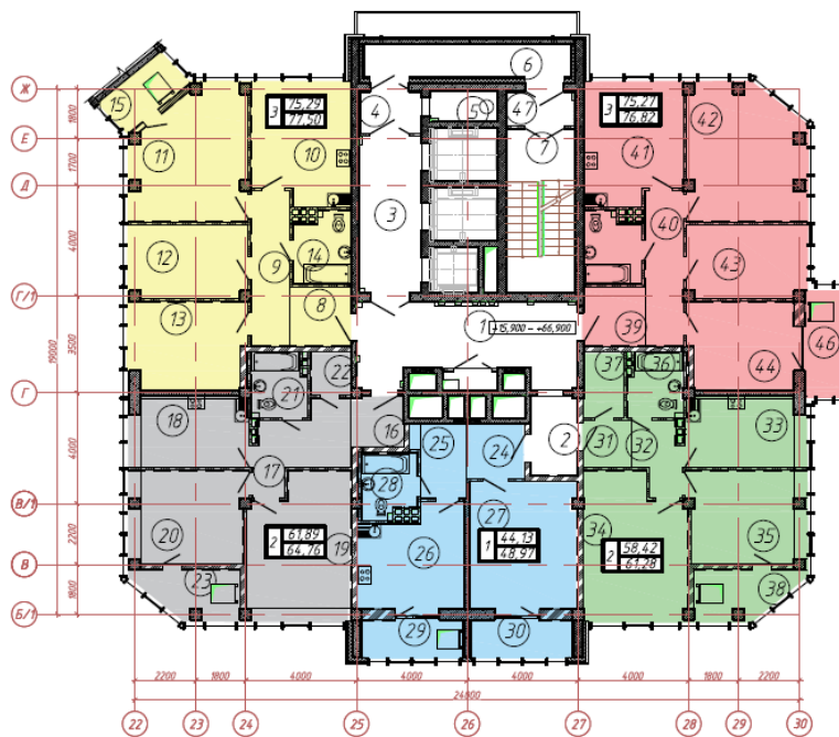
Жилое помещение выделено цветом