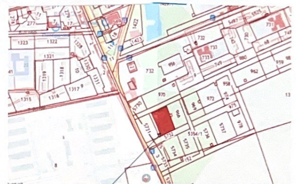
рассматриваемый земельный участок