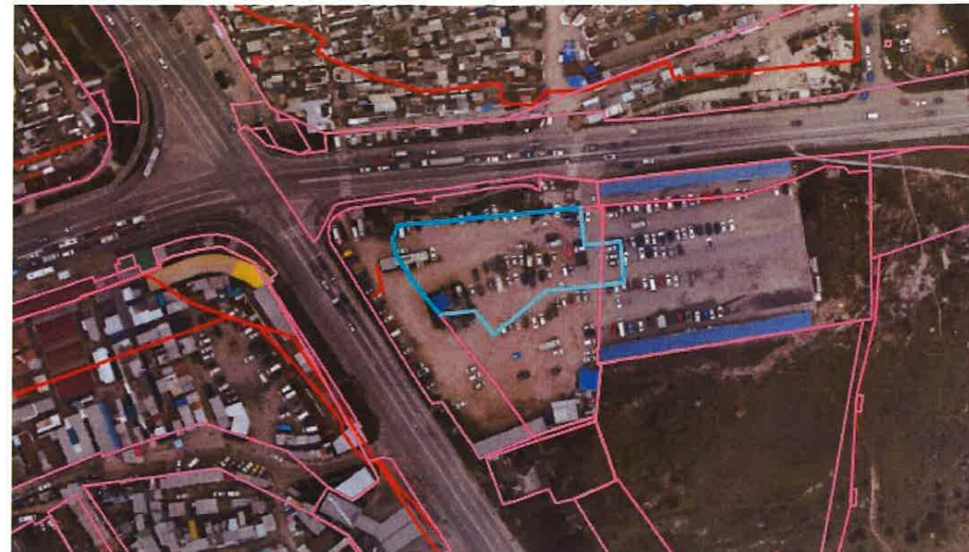
Ситуационный план (М 1:1000):

Проектирование в соответствии с приказом Министерства культуры Российской Федерации от 12.08.2016 №1864 «Об утверждении требований к осуществлению деятельности и градостроительным регламентам в границах территории объекта культурного наследия федерального значения – достопримечательное место «Древний город Херсонес Таврический и крепости Чембало и Каламита».