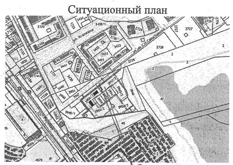
Земельный участок с кадастровым номером 68:20:3660003:3957

Примечание: предусмотреть вынос инженерных сетей, попадающих в зону строительства.