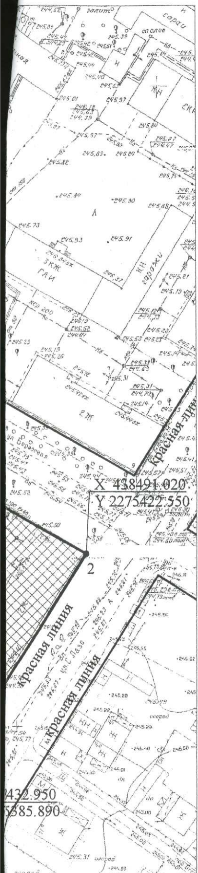
ЧЕРТЁЖ ГРАДОСТРОИТЕЛЬНОГО ПЛАНА ЗЕМЕЛЬНОГО УЧАСТКА составлен по съёмке выполненной НО "КузбассТИСИЗ" г. Новокузнецк в 1984 г. М 1:500, (съёмка подлежит корректировке).

(1) - место допустимого размещения объекта;