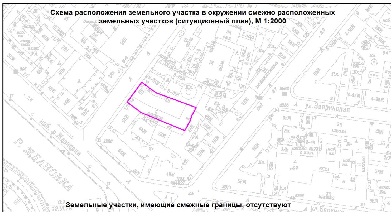
Схема расположения земельного участка в окружении смежно расположенных земельных участков (ситуационный план), М 1:2000