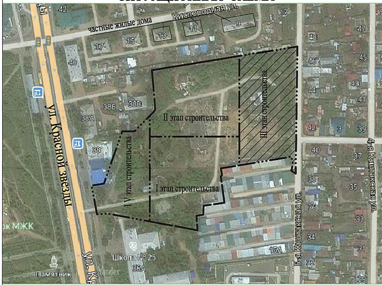
СХЕМА ПЛАНИРОВОЧНОЙ ОРГАНИЗАЦИИ ЗЕМЕЛЬНОГО УЧАСТКА. М1:500.