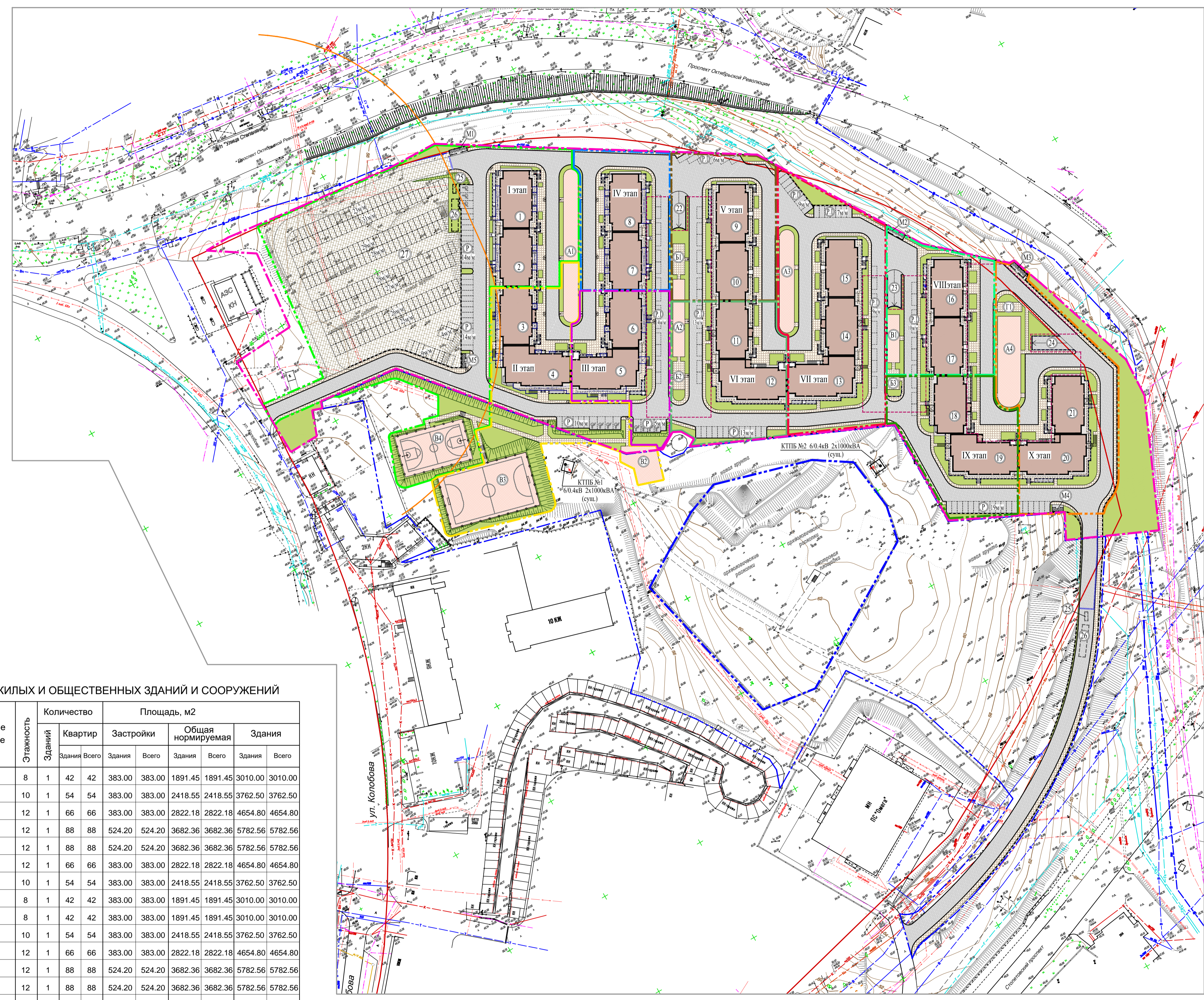
ВЕДОМОСТЬ ЖИЛЫХ И ОБЩЕСТВЕННЫХ ЗДАНИЙ И СООРУЖЕНИЙ