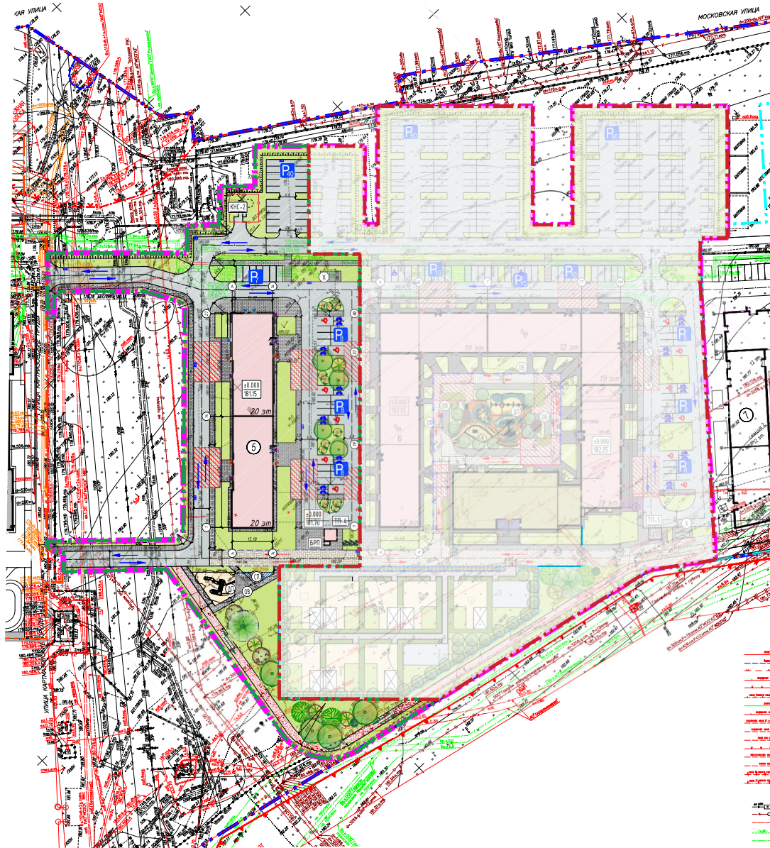
Сводная ведомость технико-экономических показателей благоустройства. Подэтап 2.1