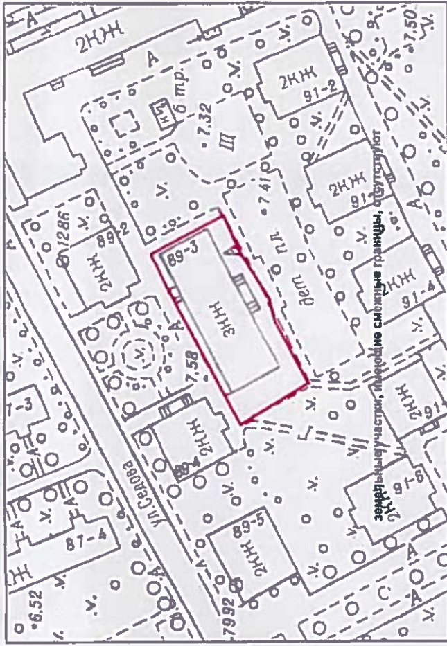
Схема расположения земельного участка в окружении смежно расположенных земельных участков (ситуационный план), М 1:1000

Чертеж градостроительного плана земельного участка разработан на топографической основе, выполненной "Трест ГРИИ" в 2014 г., М1:2000.