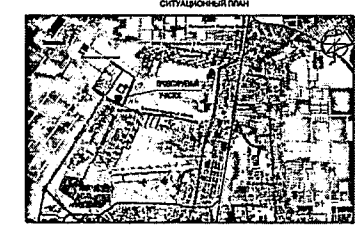
КООРДИНАТЫ ТОЧЕК ПОВОРОТНЫХ УГЛОВ ЗЕМЕЛЬНОГО УЧАСТКА