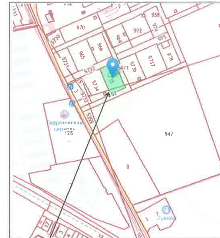
рассматриваемый земельный участок