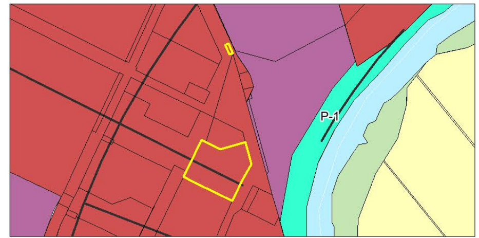
Карта зон с особыми условиями использования территории