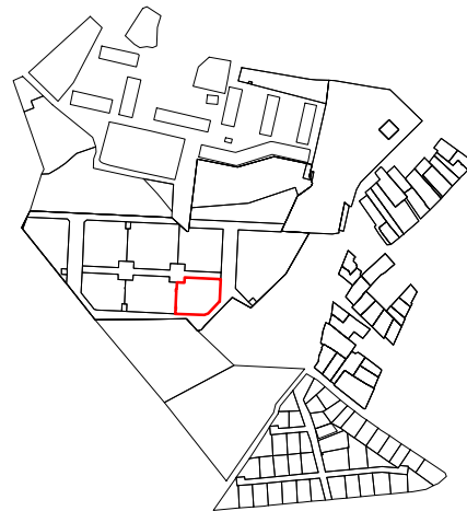
Схема расположения земельного участка относительно смежно расположенных земельных участков (Ситуационный план)