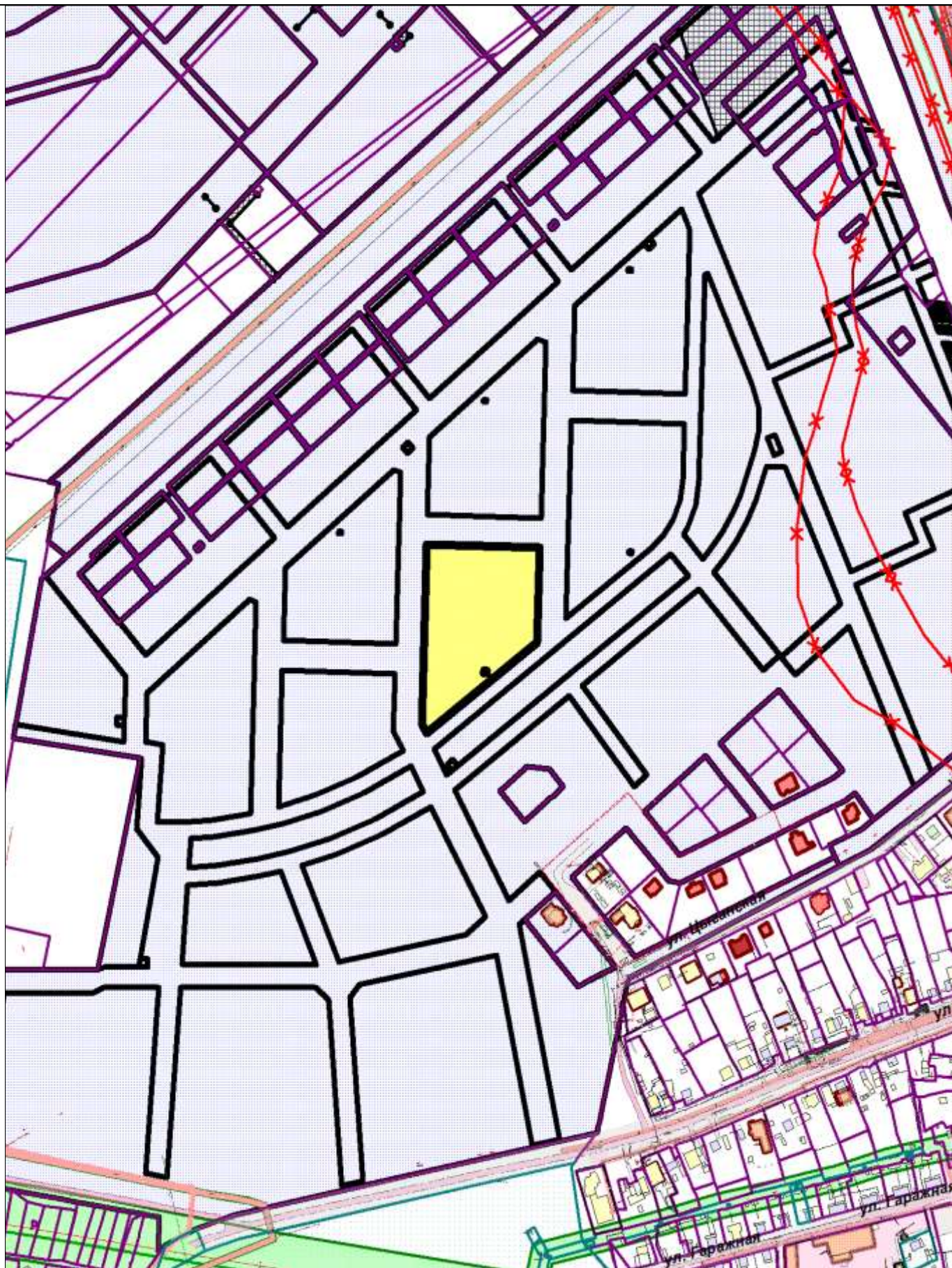
Схема расположения земельного участка в окружении смежно расположенных земельных участков