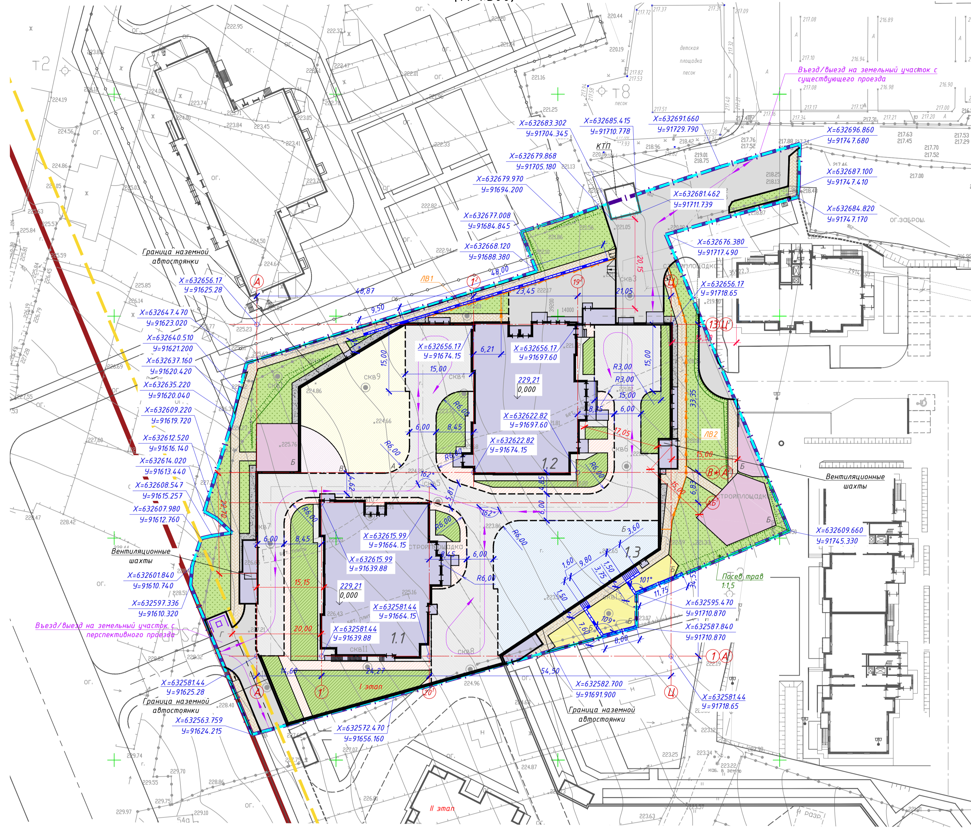
СХЕМА ПЛАНИРОВОЧНОЙ ОРГАНИЗАЦИИ ЗЕМЕЛЬНОГО УЧАСТКА (М 1:500)