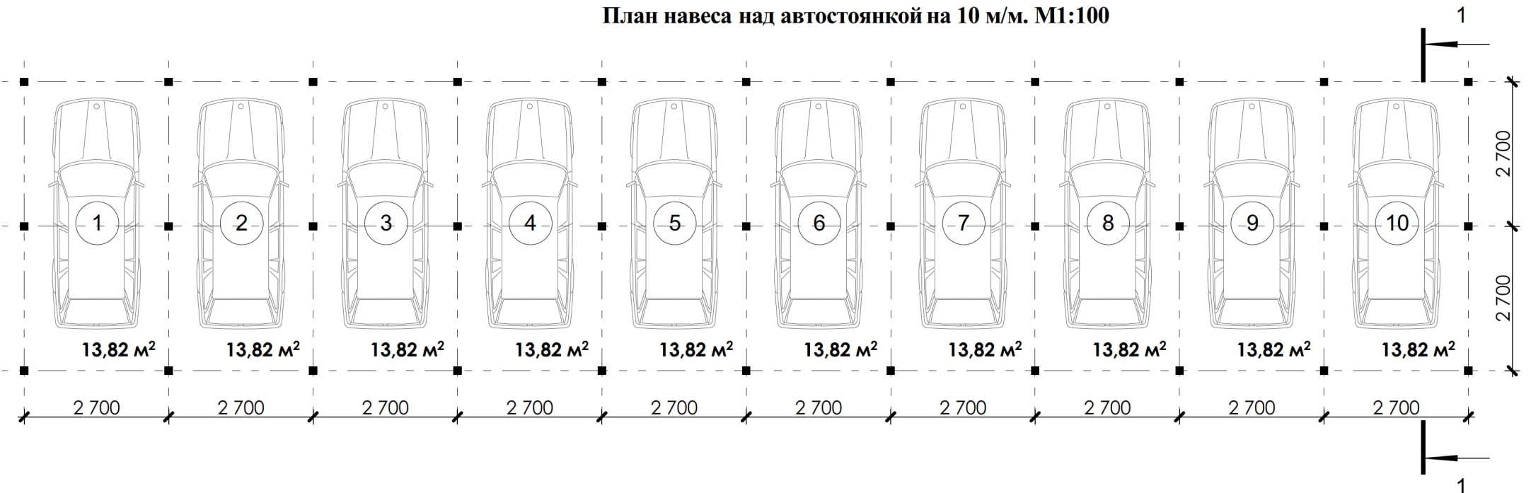
План навеса над автостоянкой на 10 м/м. М1:100