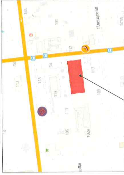
Расположение земельного участка