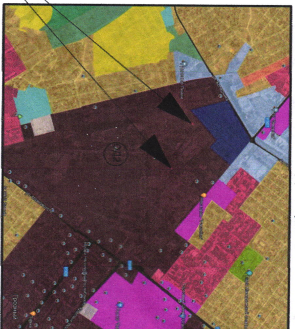
Расположение земельного участка