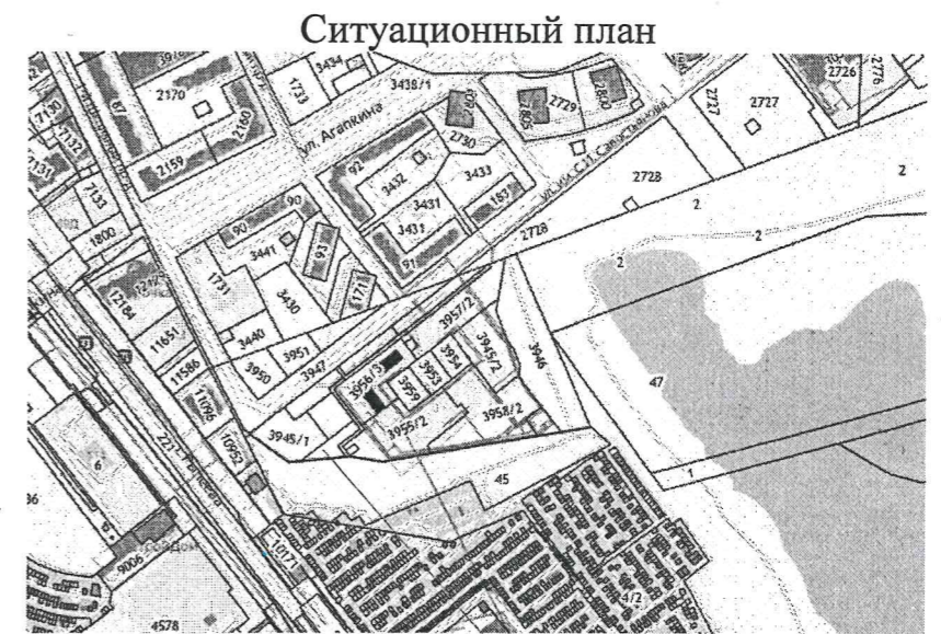
Земельный участок с кадастровым номером 68:20:3660003:3955

Примечание: предусмотреть вынос инженерных сетей, попадающих в зону строительства.