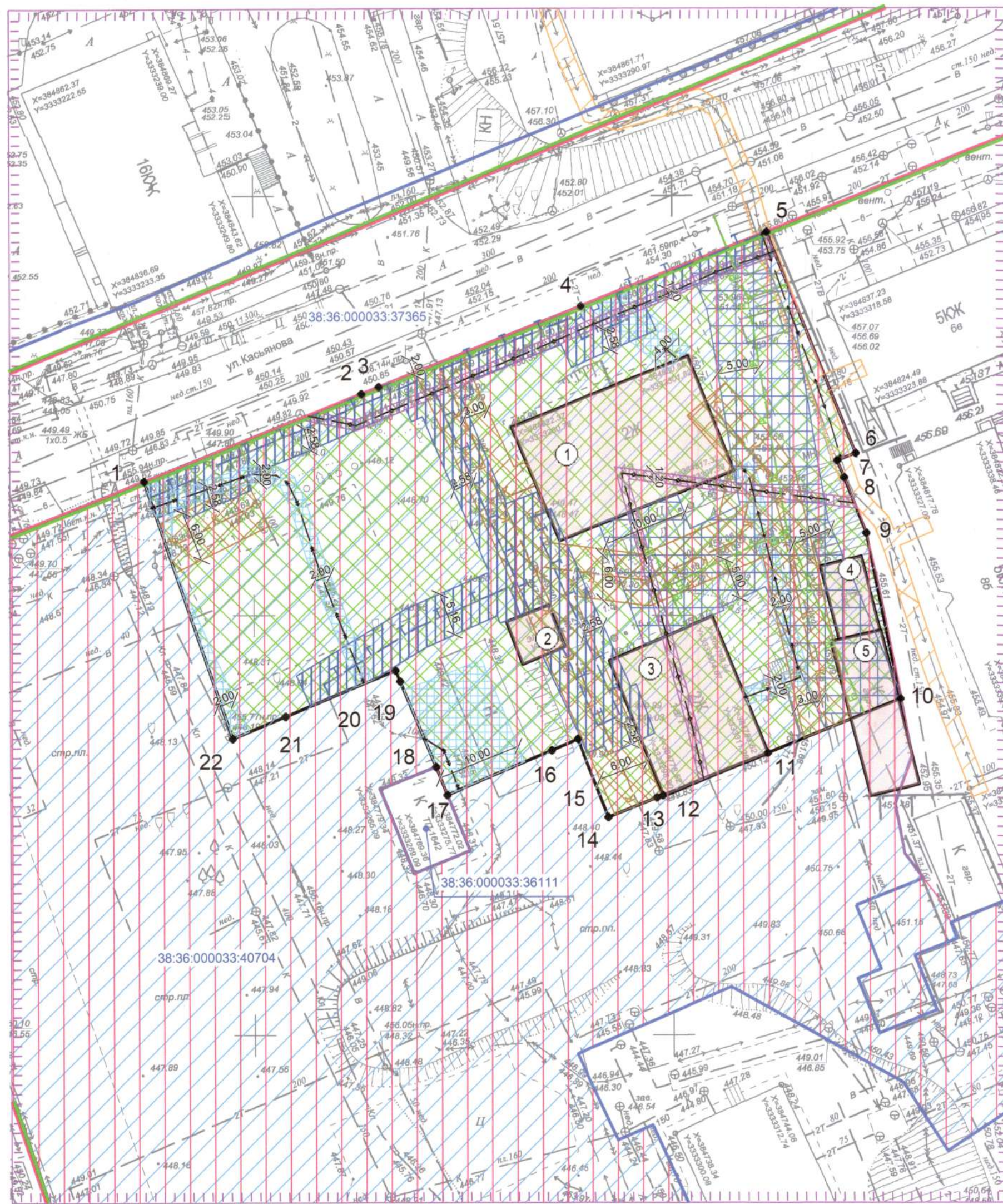
Схема расположения точек и участков для точек подключения к сетям инженерно-технического обеспечения