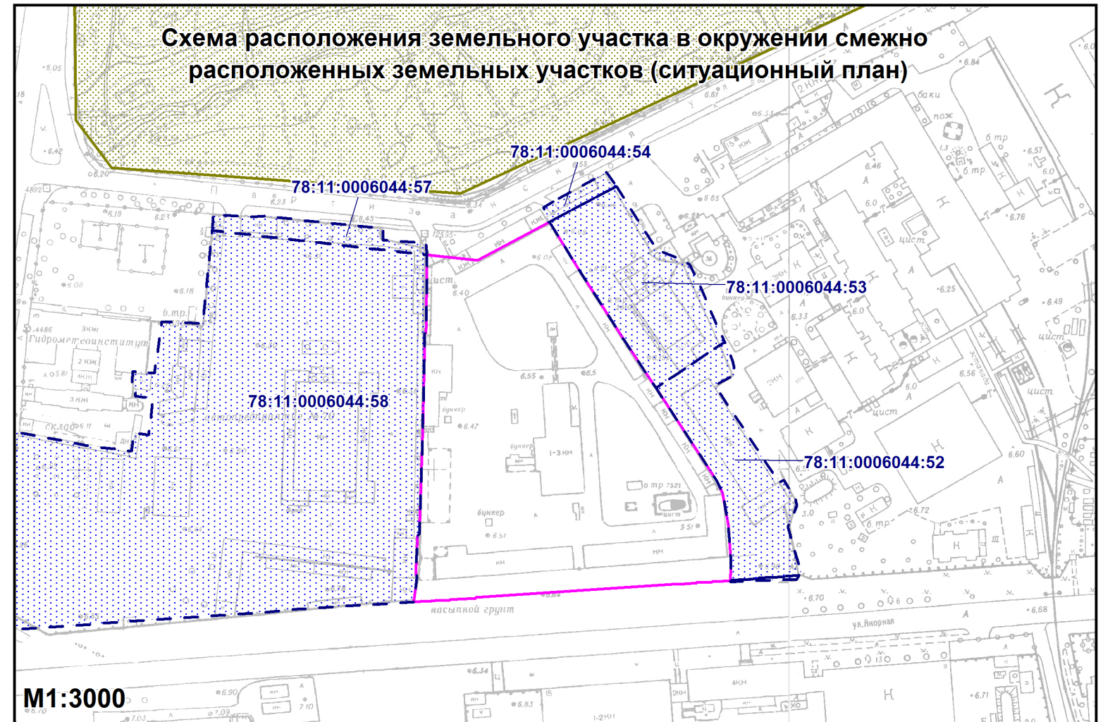
Схема расположения земельного участка в окружении смежно расположенных земельных участков (ситуационный план)

- смежные земельные участки, прошедшие государственный кадастровый учет