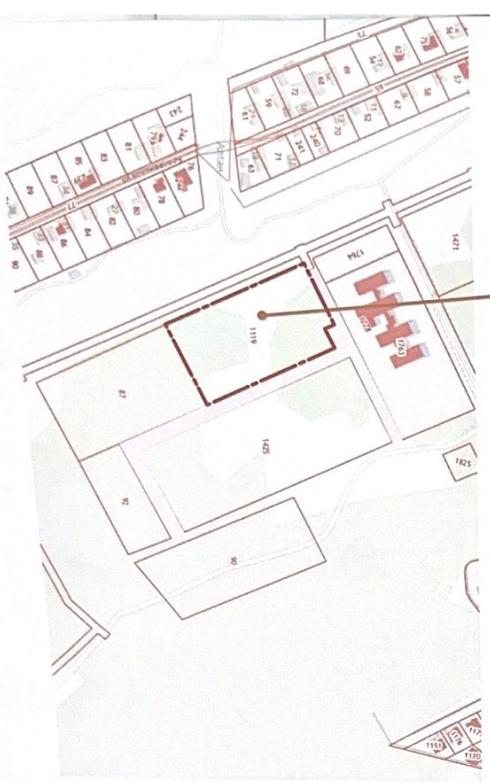
Отображение земельного участка и зон сервитута