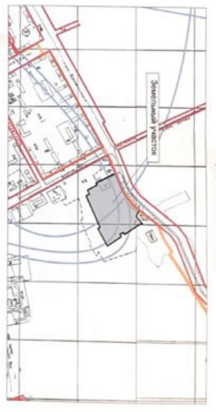
Ситуационный план М 1:5000

Применение системы координат МСК-22, система высот Балтийская Проектирование объекта выполняется с соблюдением требований строительных, санитарно-гигиенических и противопожарных норм.