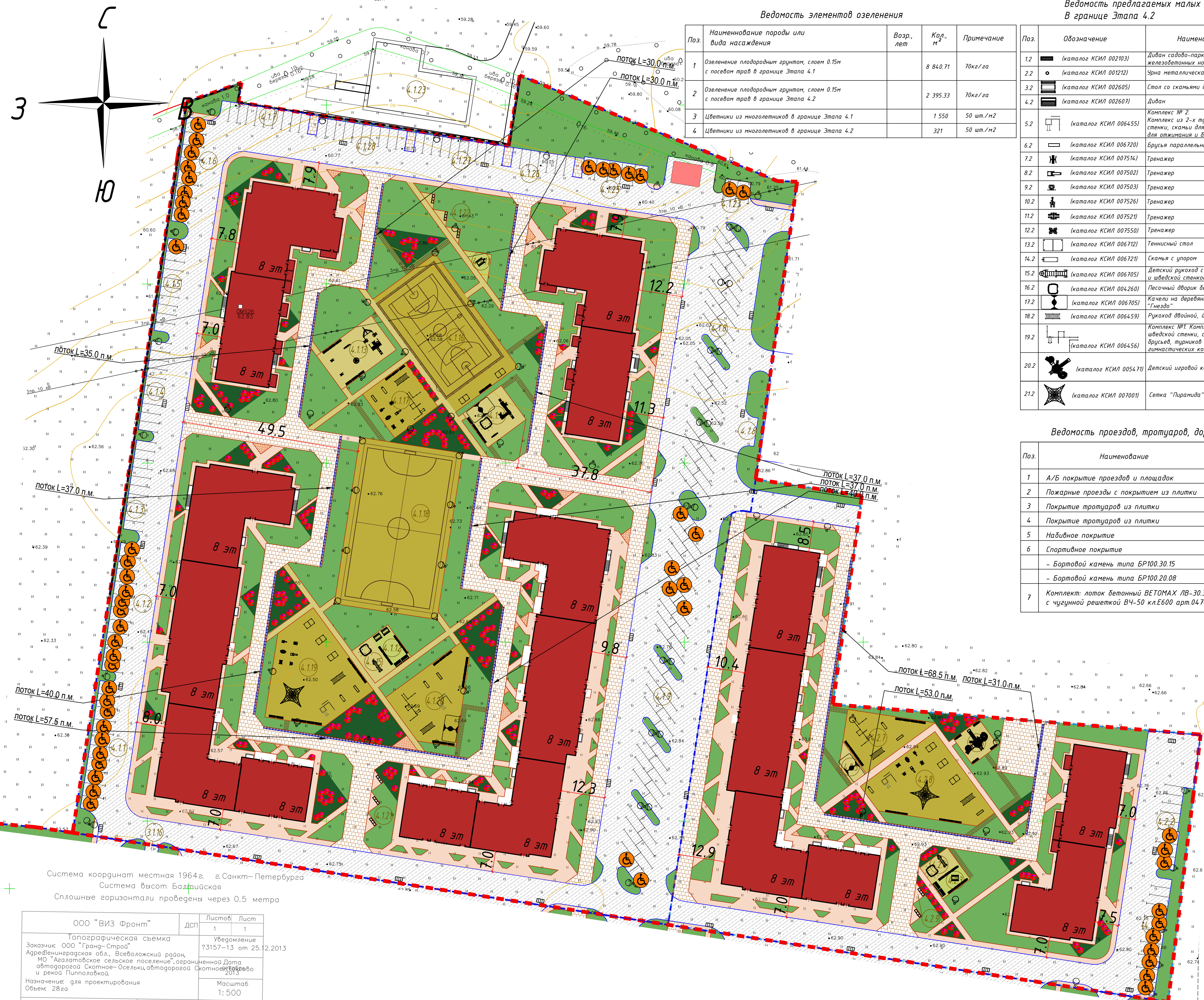
Ведомость элементов озеленения