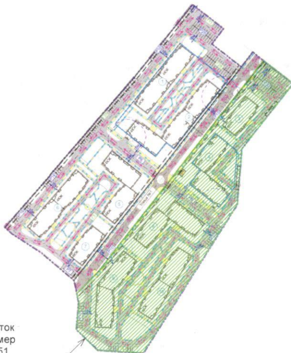
Земельный участок кадастровый номер 90:12:090103:4251