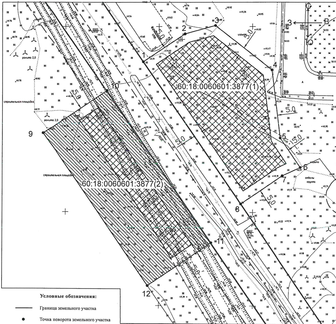
ЧЕРТЁЖ ГРАДОСТРОИТЕЛЬНОГО ПЛАНА ЗЕМЕЛЬНОГО УЧАСТКА И ЛИНИЙ ГРАДОСТРОИТЕЛЬНОГО РЕГУЛИРОВАНИЯ