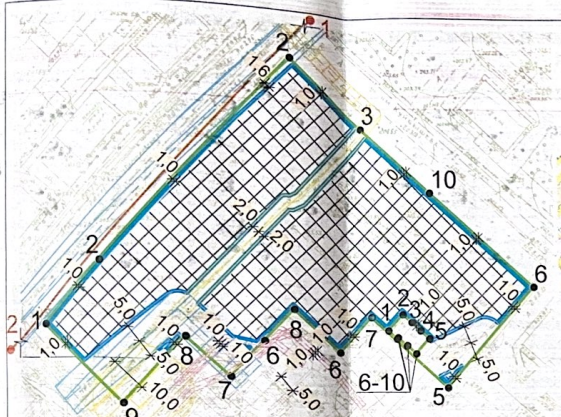
Фрагмент схемы проекта планировки территории