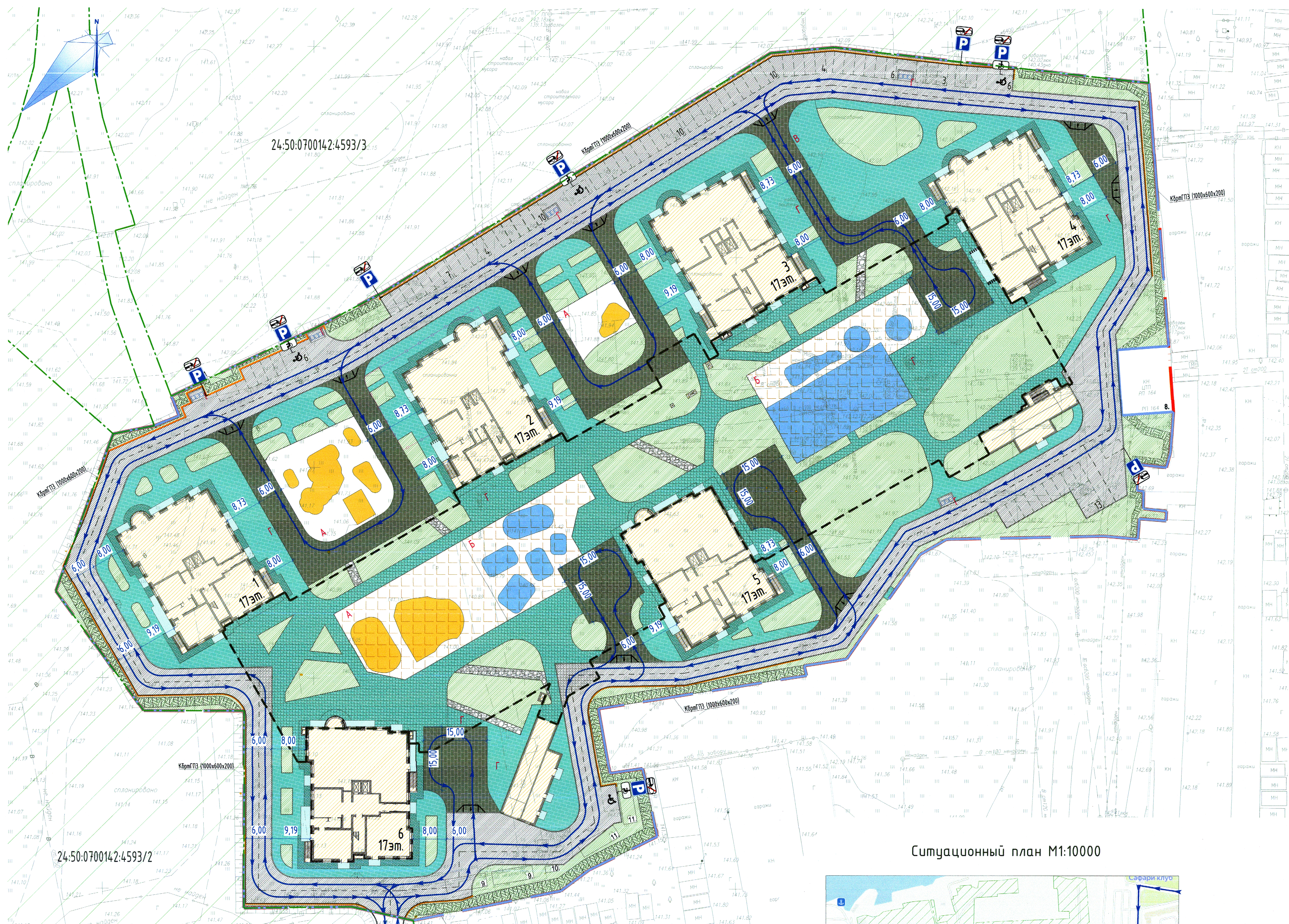
Ситуационный план М1:10000