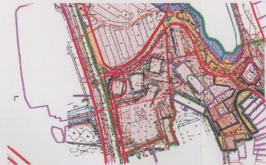
Выкопировка из карты (схемы) объекта культурного наследия федерального значения в виде достопримечательного места "Древний город Херсонес Таврический, крепости Чембало и Каламита"

Выкопировка из документации по планировке территории «Проект планировки и проект межевания части территории кадастровых кварталов 91:02:001017, 91:02:002012 в районе ул. Щитовая, ул. Адмирала Фадеева, ул. Рыбачский причал» в Гагаринском муниципальном округе города Севастополя, утвержденной постановлением Правительства от 13.12.2019 № 655-ПП