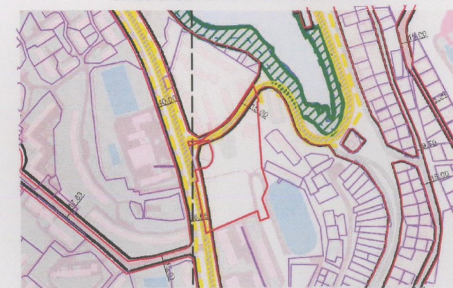
Выкопировка из Генерального плана города Севастополя