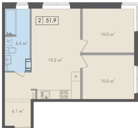
Схема жилого помещения (квартиры)