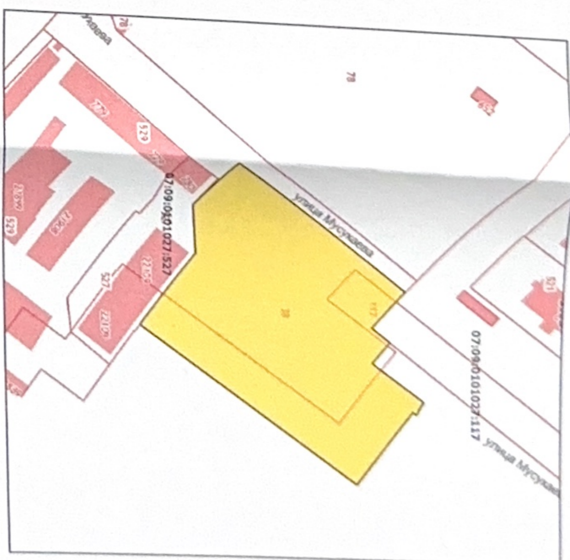
описание границ земельного участка