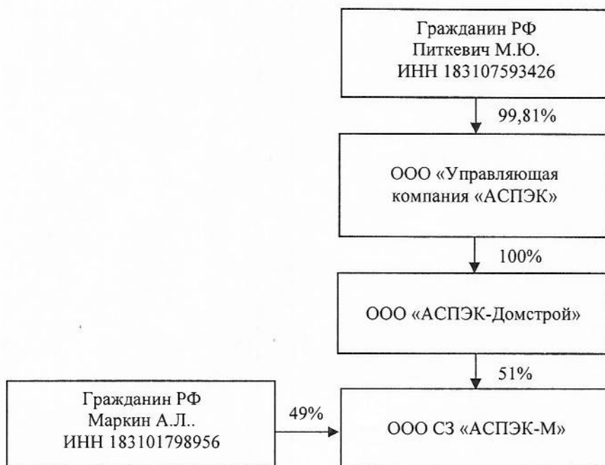
Структура владения ООО СЗ «АСПЭК-М»