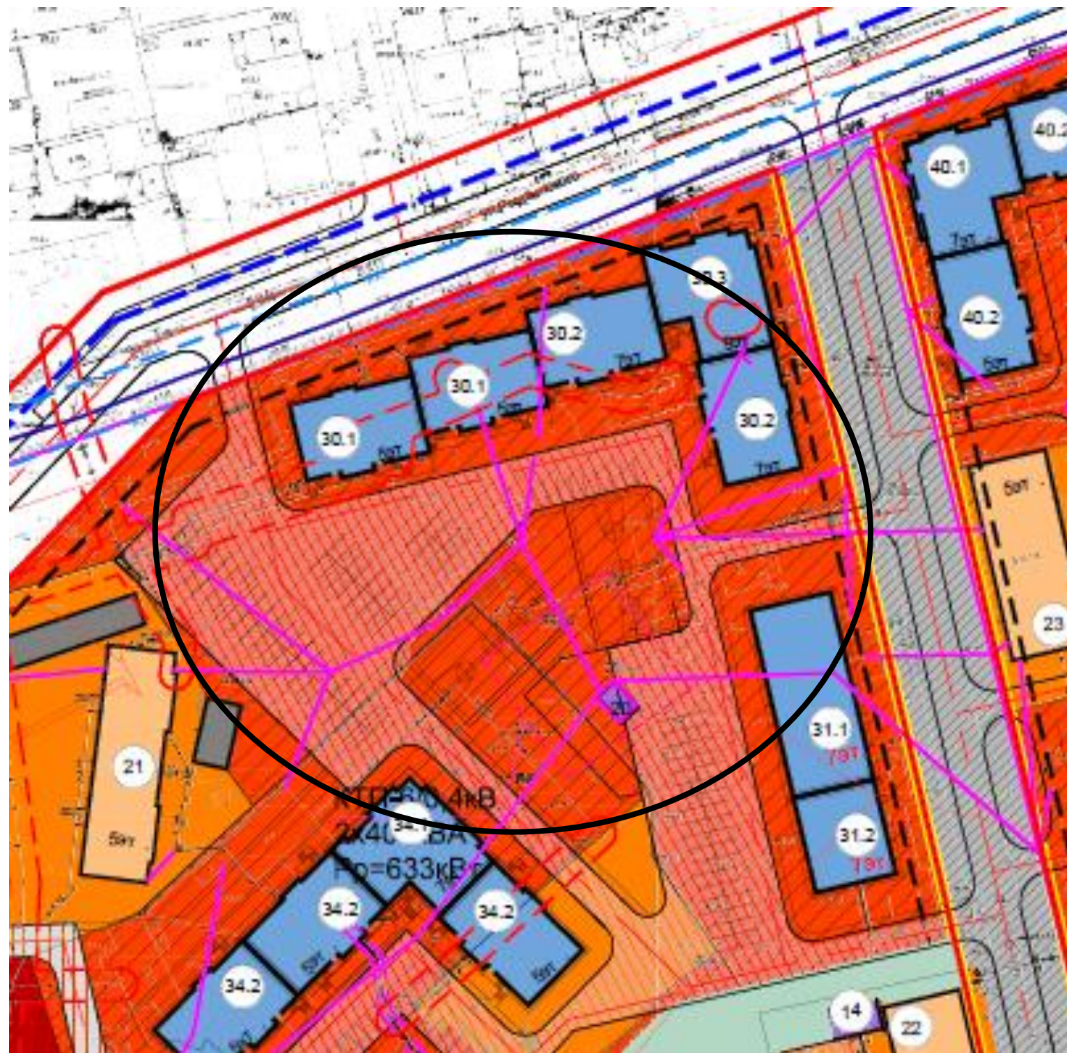
По ППТ-многоэтажная жилая застройка