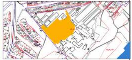
Положение земельного участка