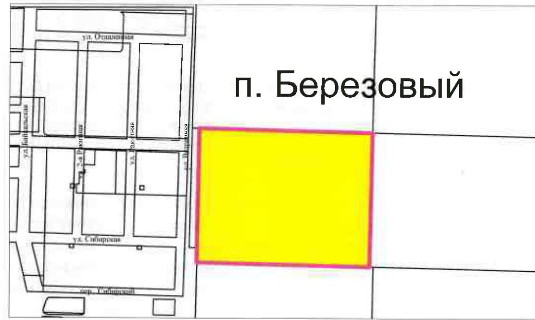
СХЕМА РАСПОЛОЖЕНИЯ ЗЕМЕЛЬНОГО УЧАСТКА В ОКРУЖЕНИИ СМЕЖНО РАСПОЛОЖЕННЫХ ЗЕМЕЛЬНЫХ УЧАСТКОВ (СИТУАЦИОННЫЙ ПЛАН)