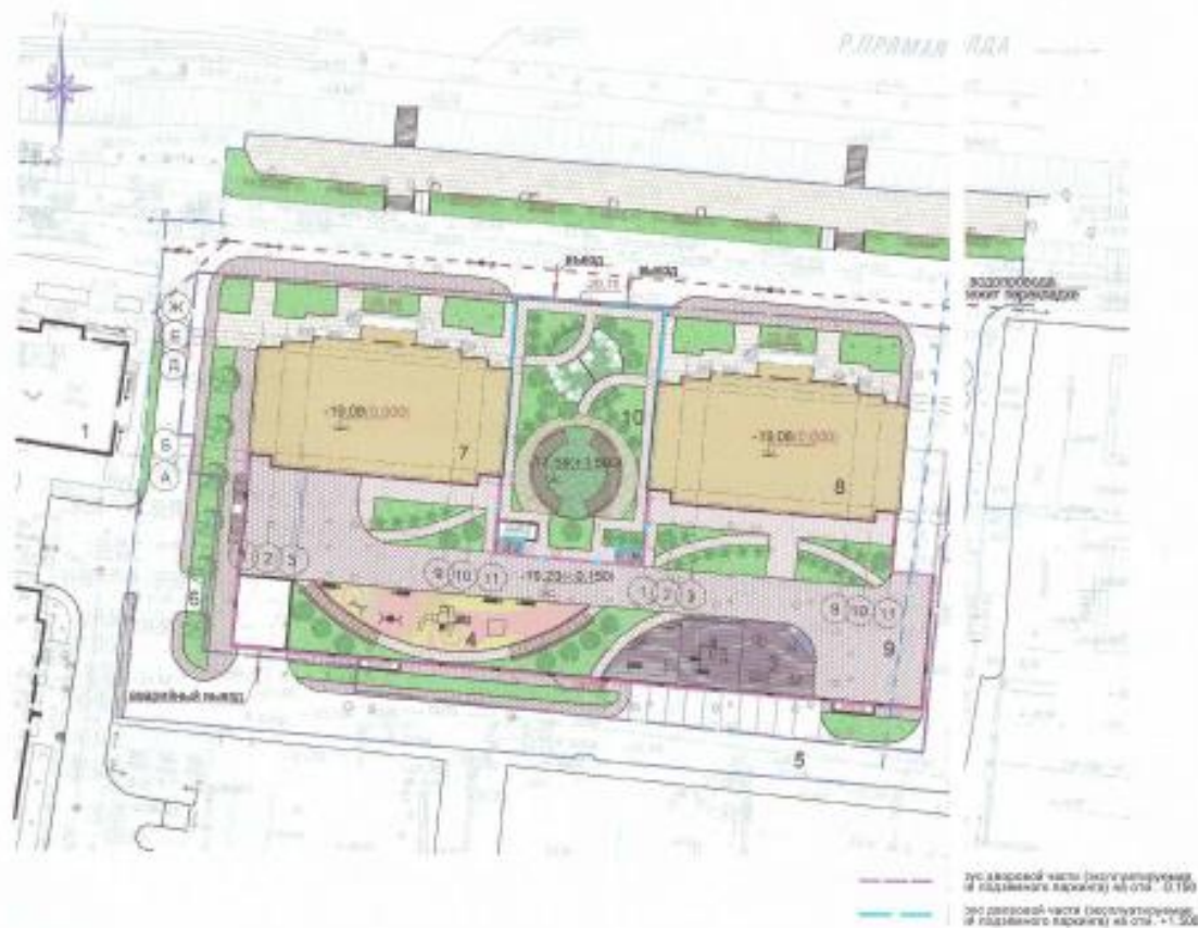
ТАБЛИЦА Т.ЭП по ГП