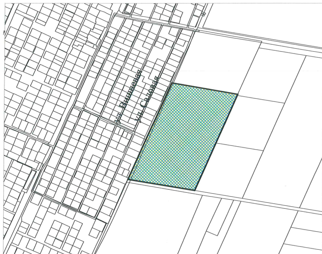
СХЕМА РАСПОЛОЖЕНИЯ ЗЕМЕЛЬНОГО УЧАСТКА В ОКРУЖЕНИИ СМЕЖНО РАСПОЛОЖЕННЫХ ЗЕМЕЛЬНЫХ УЧАСТКОВ (СИТУАЦИОННЫЙ ПЛАН)