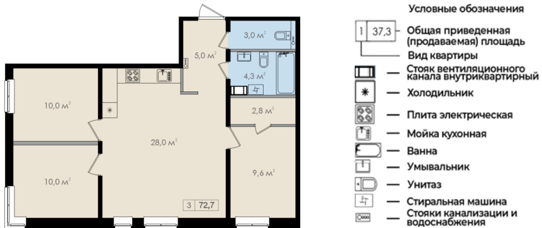
Схема жилого помещения (квартиры)

Объекты, указанные в условных обозначениях, и их предполагаемые места установки не входят в состав объекта (квартиры) и не подлежат передаче участнику долевого строительства. Данные сведения носят информационный характер.