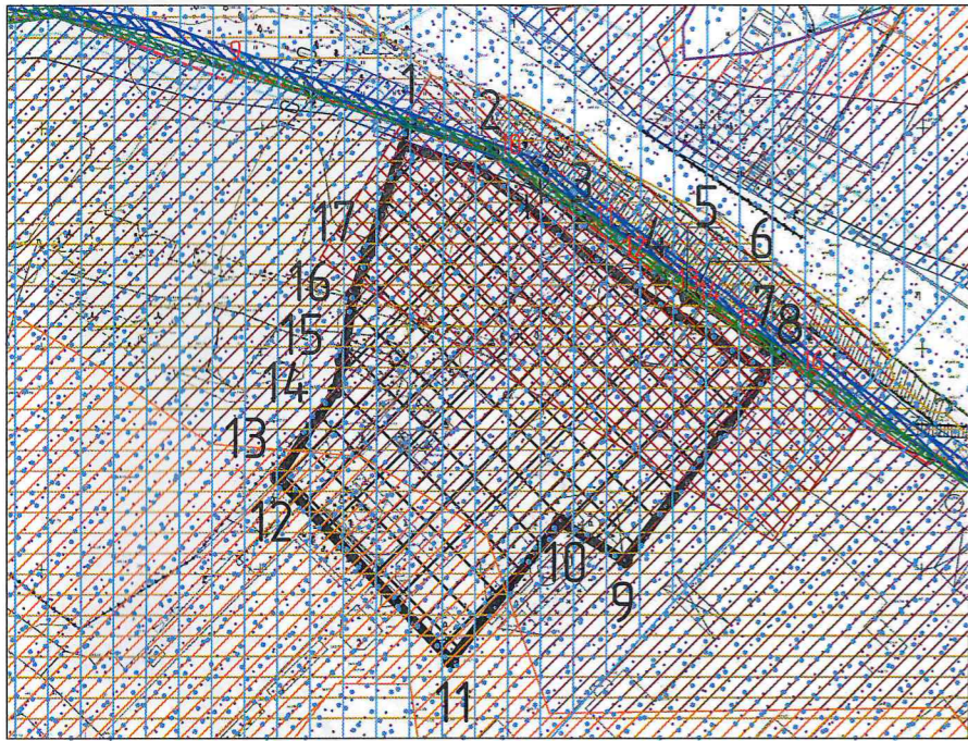
Чертеж градостроительного плана земельного участка (для надземной части здания)