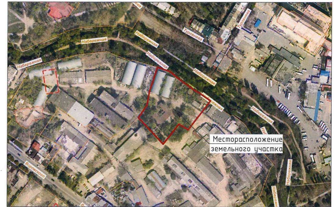
Фрагмент карты зон с особыми условиями использования территории