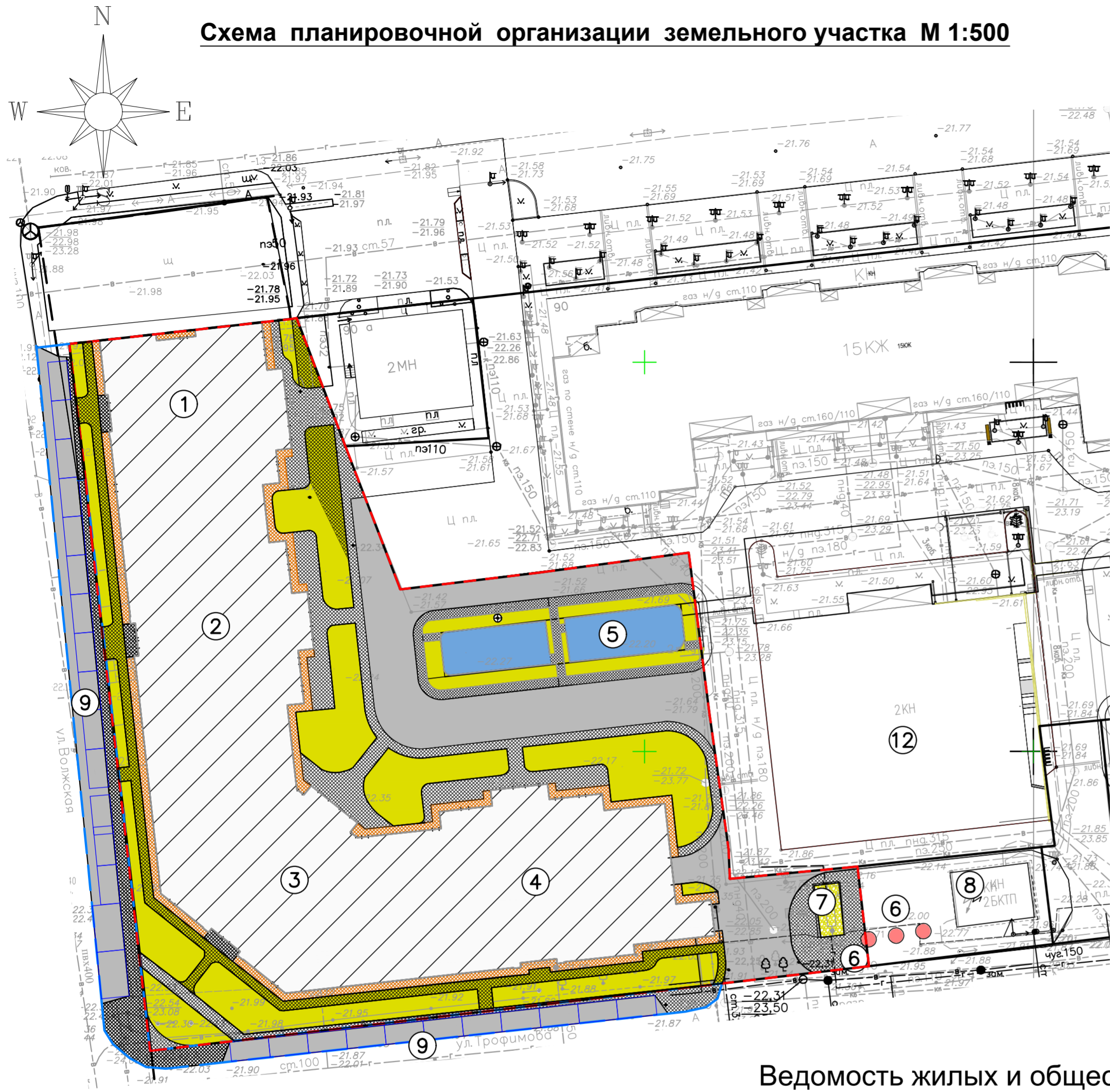
Схема планировочной организации земельного участка М 1:500