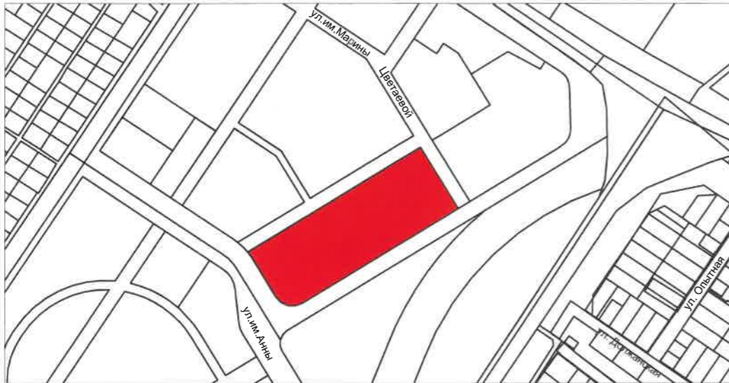
СХЕМА РАСПОЛОЖЕНИЯ ЗЕМЕЛЬНОГО УЧАСТКА В ОКРУЖЕНИИ СМЕЖНО РАСПОЛОЖЕННЫХ ЗЕМЕЛЬНЫХ УЧАСТКОВ (СИТУАЦИОННЫЙ ПЛАН)