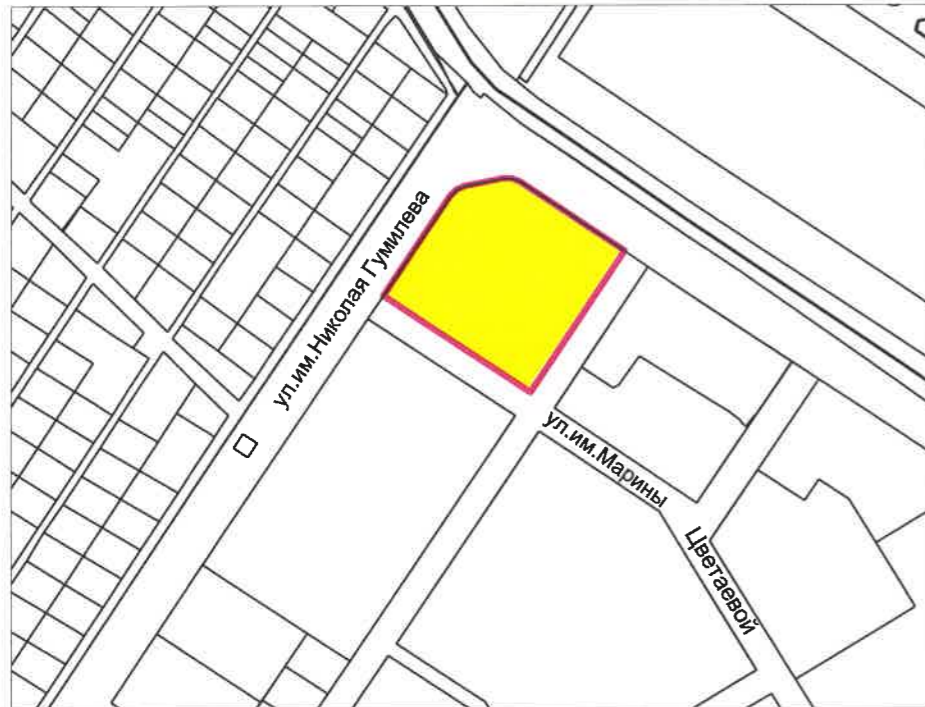
СХЕМА РАСПОЛОЖЕНИЯ ЗЕМЕЛЬНОГО УЧАСТКА В ОКРУЖЕНИИ СМЕЖНО РАСПОЛОЖЕННЫХ ЗЕМЕЛЬНЫХ УЧАСТКОВ (СИТУАЦИОННЫЙ ПЛАН)