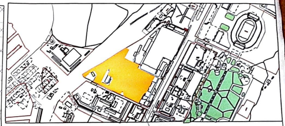
положения земельного участка