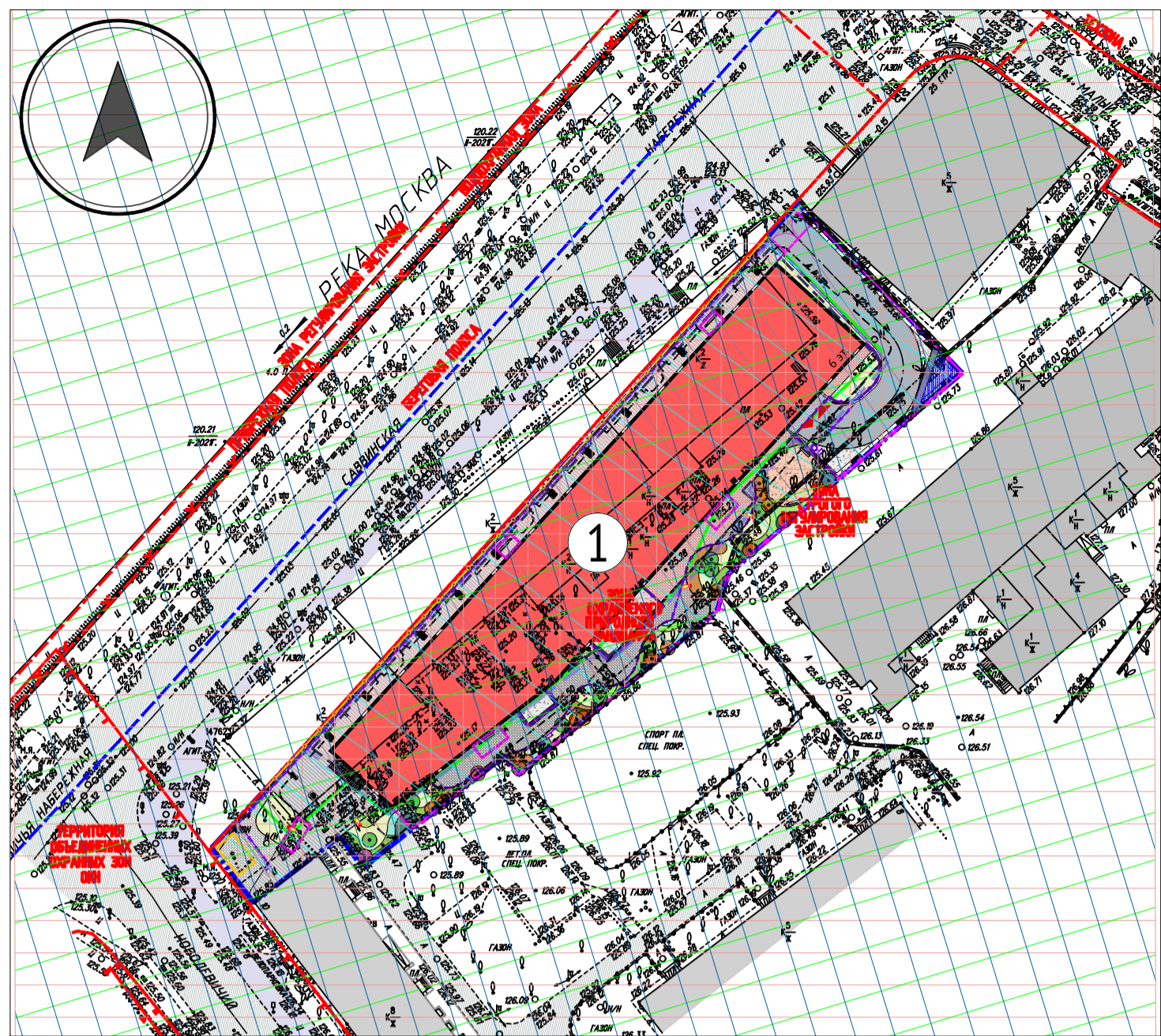
СХЕМА ГРАДОСТРОИТЕЛЬНЫХ ОГРАНИЧЕНИЙ